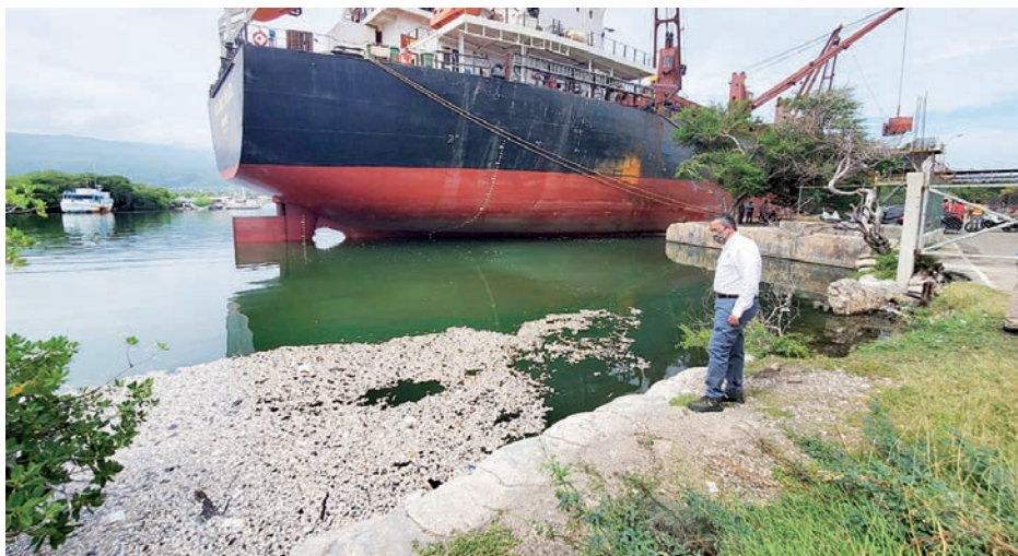
Ministro de Medio Ambiente, Orlando Jorge Mera, supervisa trabajos de investigación sobre muerte de peces en Barahona.